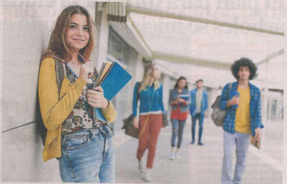
Más de 79.000 usuarios únicos consultaron en 2020 los contenidos de la plataforma orienta.ibercaja.es.

Además, también cuenta con gran cantidad de información detallada sobre las diferentes titulaciones de grados universitarios, formación profesional y otras enseñanzas de régimen especial se-