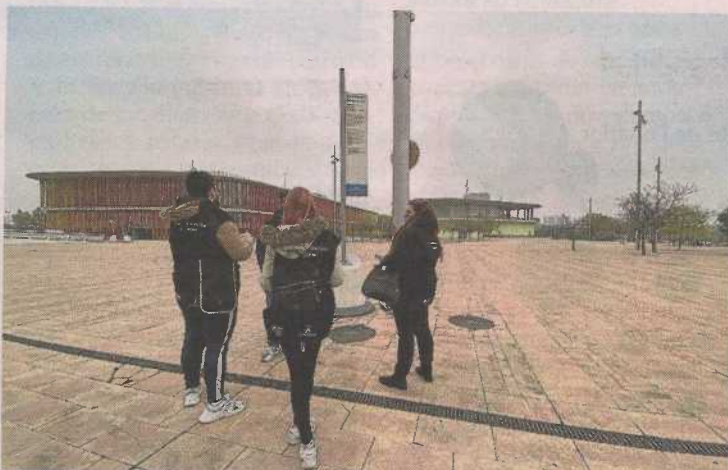
Evaluación de la accesibilidad de la Ciudad de la Justicia de Zaragoza.

Ya se han adaptado a lectura fácil 17 sentencias de modifica-