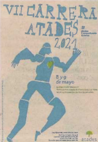
Cartel diseñado en el Centro Integra de Atades.

Para este evento deportivo, Atades propone dos jornadas inclusivas y solidarias. La VII Carrera Atades tendrá dos modalidades -5 km y 1 km- y en ella pue-